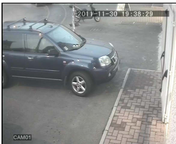
SCHERMATA ESEMPIO D1