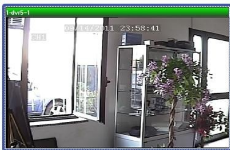
IMMAGINE WDR OFF , la luce posteriore disturba notevolmente la visione