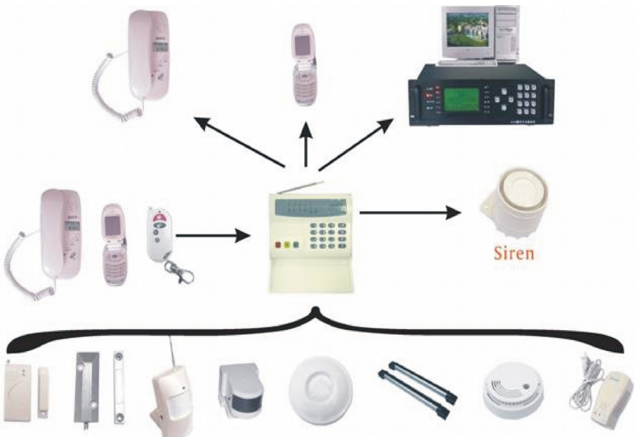
Foto e caratteristiche del prodotto si riferiscono al momento in cui è stato stampato il manuale, differenze di minore entità sono possibili in corso di produzione. Eventuali differenze non influiscono sulla sicurezza o sulle prestazioni del prodotto.

Lo schema seguente indica le principali operazioni di base.